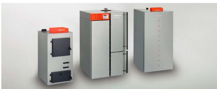
Спектр котлів Vitoligno компанії Viessmann